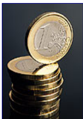
Debat rondom het besteden van Zoetermeers geld.

Deze vraag stond centraal in het Voorjaarsdebat rondom het resultaat uit 2007, een overschot van € 17 miljoen (op een begroting van ongeveer € 400 miljoen).