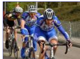
Evenementen organiseren, mandaat van B& W!

Het college heeft in haar beantwoording aangegeven het te betreuren dat dit evenement buitengewoon veel geluidshinder met zich mee heeft gebracht. Beterschap is beloofd. De toename van evenementen op zondag is in Zoetermeer een feit. Als fractie zijn en blijven we principieel tegen deze zondagsinvulling, maar als u met ons wilt denken over de juiste opstelling bij ieder komend evenement, graag.