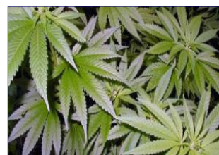
Positief: veel weetplantages ontmanteld.

Stemverklaringen hadden wij bij het Stadstheater. We gingen niet akkoord met de uitbreiding van de kleine zaal - binnen het groot onderhoud - op kosten van de gemeenschap. Ook niet voor het totaal van € 125.000 om de Campina Ronde van het Groene Hart 20 minuten door Zoetermeer te laten fietsen (€ 75.000) en voor een nog onbekend evenement van € 50.000. Om de extra controleurs van Handhaving te betalen uit het potje “Wijk-aan-zet” van de burgers vonden wij niet terecht. Dat hebben we nu net aan burgers zelf gegeven voor eigen activiteiten. Een ander dekkingsmiddel dus!