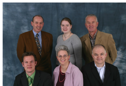
De nieuwe fractie