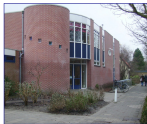
Oude gebouw Parousia

wil de provincie niet. Wel is een tijdelijke oplossing mogelijk, maar dan moet er wel uitzicht zijn op een definitieve oplossing.”