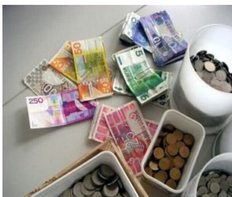
7 vette en 7 magere jaren

Zoals wellicht bekend is, regelt de Wet Maatschappelijke Ondersteuning (Wmo) allerlei vormen van hulp en dienstverlening 'dicht bij huis', zoals huishoudelijke hulp, mantelzorg en psychosociale begeleiding. Doelgroepen in het kader van de Wmo zijn gehandicapten, ouderen, chronisch zieken, personen met psychische problemen, etc. De uitvoering van deze wet is aan de gemeenten opgedragen. De gemeente Zoetermeer evalueert jaarlijks de wijze waarop de Wmo in Zoetermeer ten uitvoer wordt gebracht. De resultaten zijn in de commissie Samenleving van de gemeenteraad besproken. Zo is onlangs weer een bijeenkomst geweest die voor een deel gewijd was aan de Wmo.