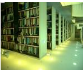
Geen contributie 16- en 17-jarigen

Onze digitale Nieuwsbrief voor leden. Is uw e-mailadres niet bij ons bekend en wilt u deze Nieuwsbrief ontvangen, geeft u dan uw e-mailadres door.