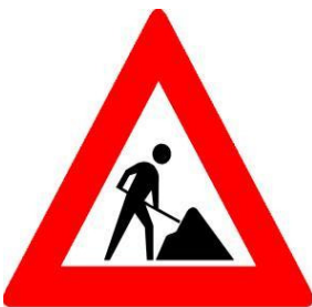
Werk in uitvoering

Tot voor kort is er steeds gesproken over de "knip" in de Dorpsstraat. De achterliggende gedachte was daarbij een betere verbinding te maken tussen het westelijke deel van de Dorpsstraat en de rest. Ook in het kader van de Culturele As, een betere verbinding van de Dorpsstraat met het Stadshart, was het wenselijk het autoverkeer over de Leidse- en Delftsewallen te beperken. Zo creëer je meer ruimte voor de voetganger. Ook het sluipverkeer uit Seghwaert wordt zo een halt toegeroepen.